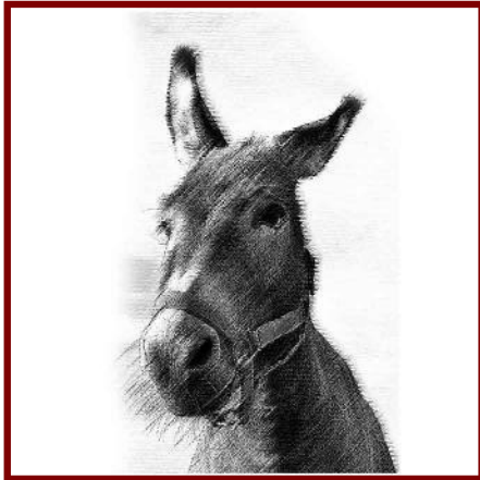
Oren van een ezel

Teken de verschillende stappen van de steek van prins carnaval.